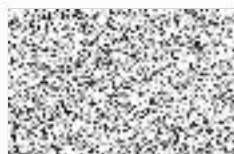
vedoucí útvaru 402